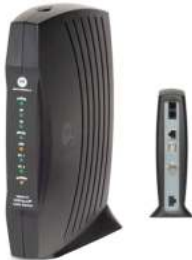
Figura 5.9: Cable modem

To connect your computer to the internet, you need a modem. A modem is a device that sends and receives computer information over a telephone line or high-speed cable. Modems are sometimes built into the system unit, but higher-speed modems are usually separate components.