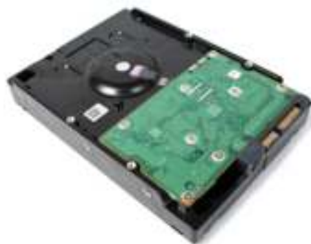
Figura 4.7: Disco rígido

Your computer's hard disk drive stores information on a hard disk, a rigid platter or stack of platters with a magnetic surface. Because hard disks can hold massive amounts of information, they usually serve as your computer's primary means of storage, holding almost all of your programs and files.