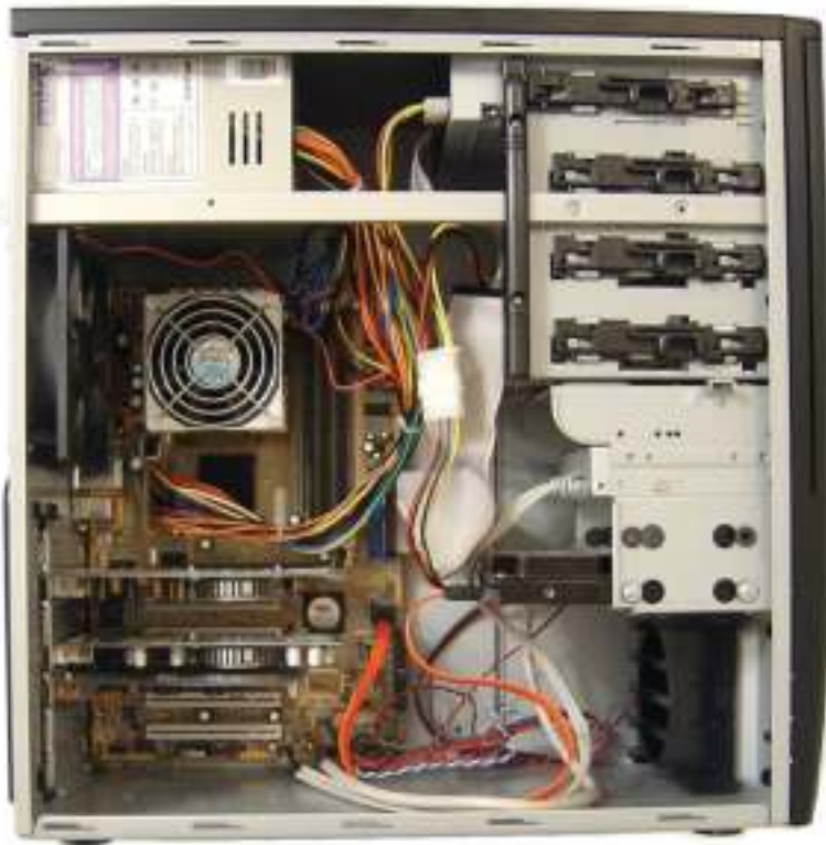
Figura 4.1: Gabinete aberto

Você já viu algum computador aberto? Nesta aula iremos abordar as peças que compõem a parte interna dos computadores e sua função para o funcionamento pleno de toda a máquina.