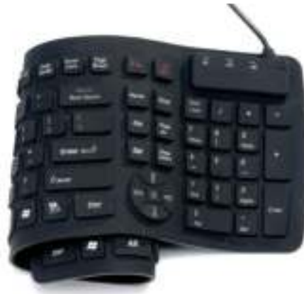
Figura 5.4: Teclado flexível