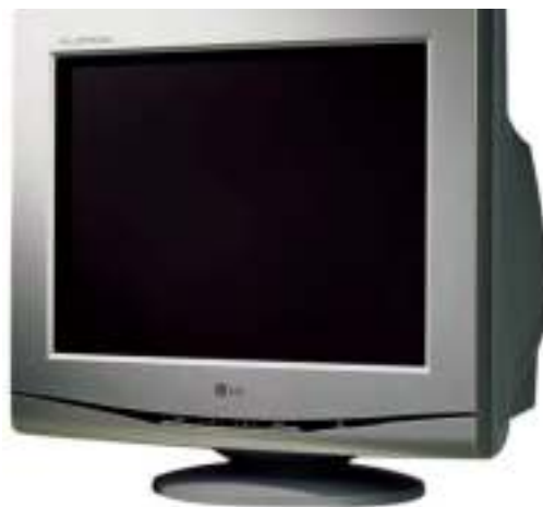
Figura 5.5: Monitor CRT

There are two basic types of monitors: CRT (cathode ray tube) monitors and LCD (liquid crystal display) monitors. Both types produce sharp images, but LCD monitors have the advantage of being much thinner and lighter. CRT monitors, however, are generally more affordable.