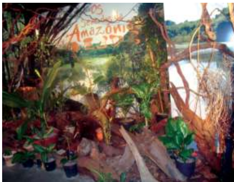
Figura 2.2: Imagens

If you have a digital camera, you can move your pictures from the camera to your computer. Then you can print them, create slide shows, or share them with others by email or by posting them on a website. You can also listen to music on your computer, either by importing (transferring to your computer) music from audio CDs or by purchasing songs from a music website. Or, tune in to one of the thousands of radio stations that broadcast over the Internet. If your computer comes with a DVD player, you can watch movies.