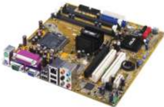
Figura 4.3: Placa mãe

A motherboard is the central printed circuit board in many modern computers and holds many of the crucial components of the system, while providing connectors for other peripherals. The motherboard is sometimes alternatively known as the main board, system board, or, on Apple computers, the logic board.