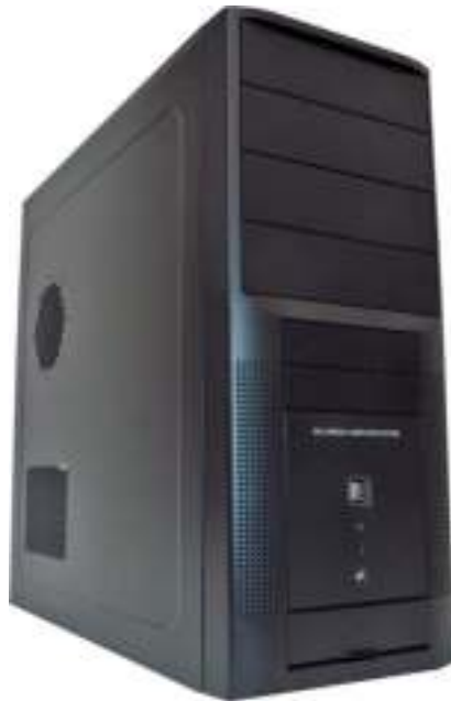
Figura 4.2: Gabinete

The case also should be capable of allowing you to expand your hardware if the need arises. The ATX case is the one most commonly used today.