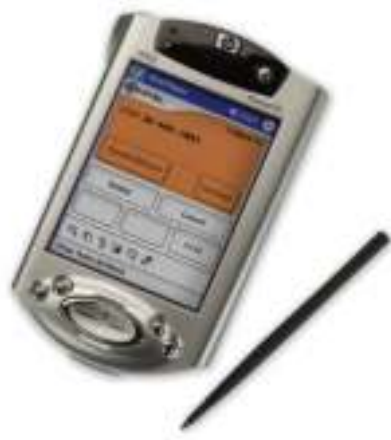
Figura 3.3: Handheld computer