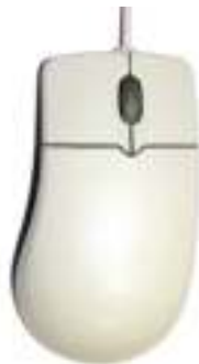
Figura 5.2: Mouse

A mouse is a small device used to point to and select items on your computer screen. Although mice come in many shapes, the typical mouse does look a bit like an actual mouse. It's small, oblong, and connected to the system unit by a long wire that resembles a tail. Some newer mice are wireless.