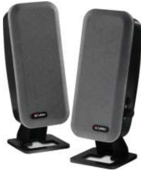
Figura 5.8: Caixinhas de som

Speakers are used to play sound. They may be built into the system unit or connected with cables. Speakers allow you to listen to music and hear sound effects from your computer.