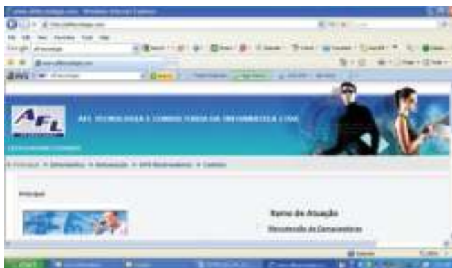
Figura 2.1: Exemplo de website