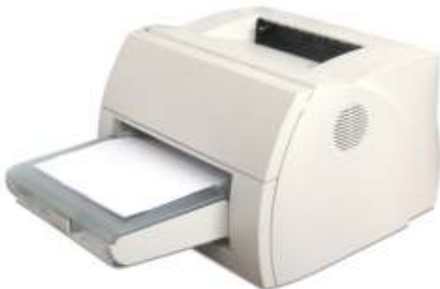
Figura 5.7: Impressora

The two main types of printers are inkjet printers and laser printers. Inkjet printers are the most popular printers for the home. They can print in black and white or in full color and can produce high-quality photographs when used with special paper. Laser printers are faster and generally better able to handle heavy use.