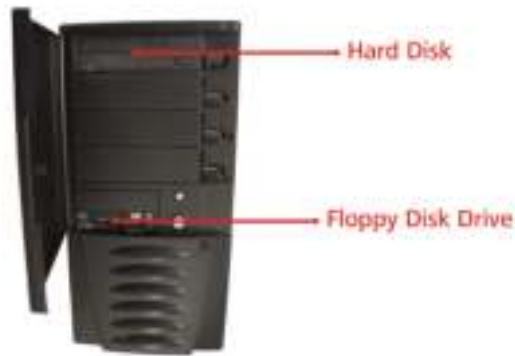
Figura 5.1: System unit