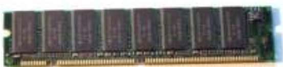
Figura 4.5: Memória RAM

RAM is an abbreviation for Random Access Memory. RAM is the computer's main memory. The computer uses RAM constantly to temporarily store information while it is working with it.