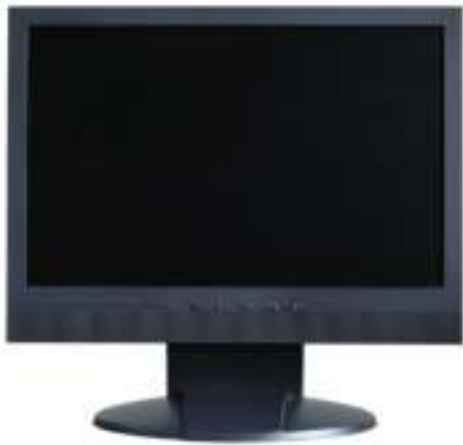
Figura 5.6: Monitor LCD