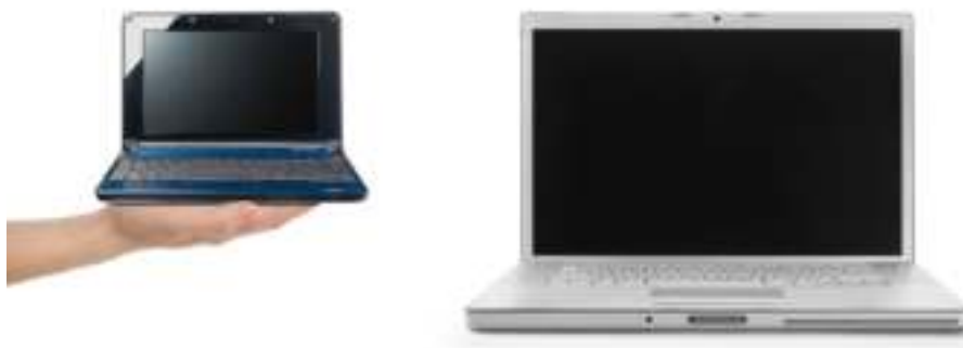
Figura 3.2: Netbook and Notebook

Laptop computers are lightweight mobile PCs with a thin screen. They are often called notebook computers because of their small size. Laptops can operate on batteries, so you can take them anywhere. Unlike desktops, laptops combine the CPU, screen, and keyboard in a single case. The screen folds down onto the keyboard when not in use.