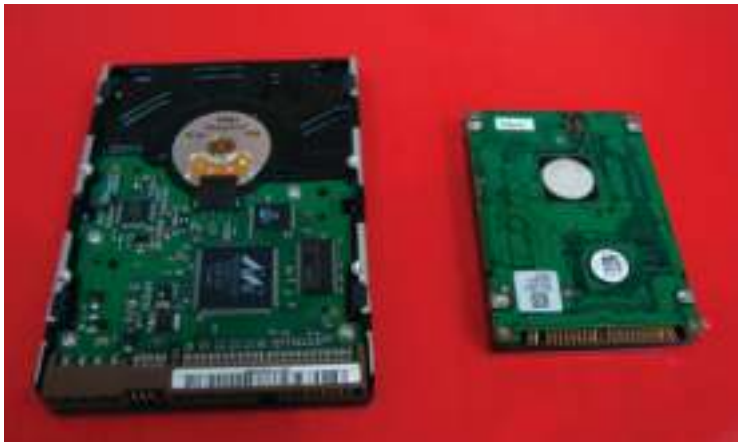
Figura 4.8: Comparação entre HD de desktop e de notebook

The hard disk drive is normally located inside the system unit.