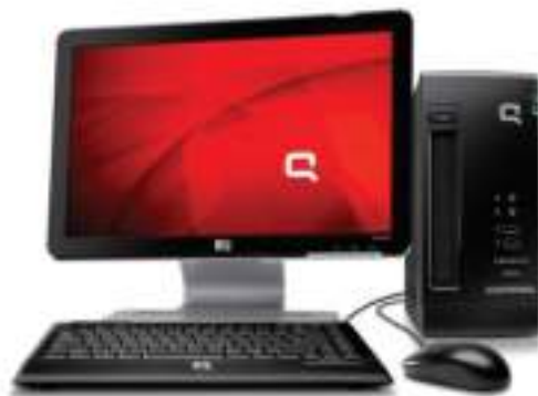
Figura 3.1: Desktop computer