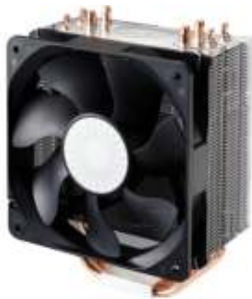
Figura 4.6: Case fan

Case fans are relatively inexpensive and are extremely important. Computer components generate quite a bit of heat and must be kept as cool as possible. The case fan is the primary source of cooling for most computers. Although the importance of the fan is often overlooked, it is the key to a long life for a computer. Most computer cases are designed to allow a person to add one or more additional case fans.