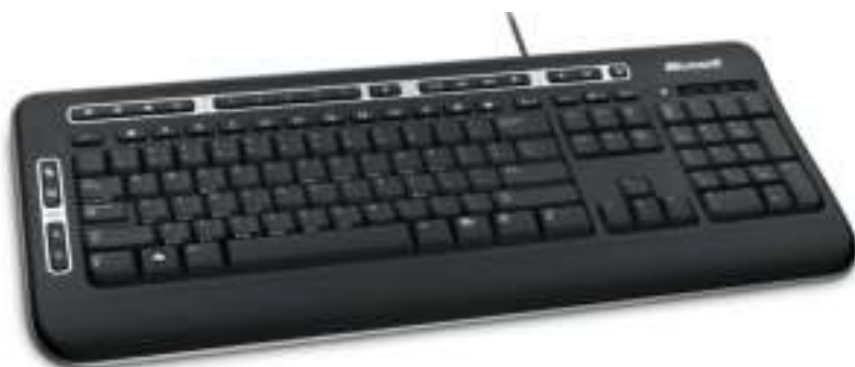
Figura 5.3: Teclado