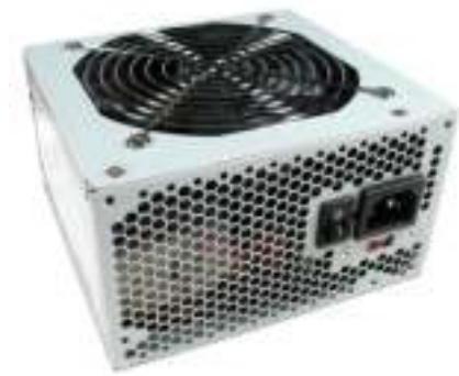
Figura 4.4: Fonte de alimentação

The power supply supplies the electrical power for a computer. It supplies power to the motherboard, drives, and certain expansion cards. It normally has at least one fan that helps cool the power supply and will assist in the task of cooling the computer.